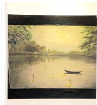
Eine geheimnisvolle, dunkle Szenerie findet sich in dem Bild mit dem Titel „See“.

Alle Bilder von Tom Gefken können bis zum 25. September im Atelier Brandt Credo, Meyerstraße 145, jeweils sonntags von 16 bis 18 Uhr betrachtet werden. Individuelle Besichtigungstermine sind nach Absprache unter Telefon 55 84 55 jederzeit möglich.