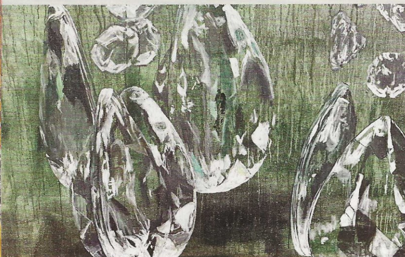
Sabine Wewer, MIRACLE (Detail), 2020, 250 x 300 cm, Acryl, Öl auf Leinwand